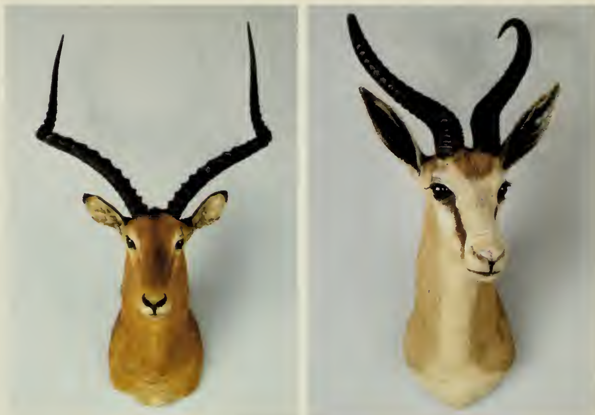
A sinistra: Impala settentrionale ( Aepyceros melampus rendilis Lönneberg, 1912); a destra: Antilope saltante ( Antidorcas marsupialis Zimmermann, 1780).